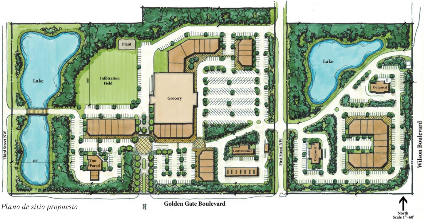
Plano de sitio propuesto